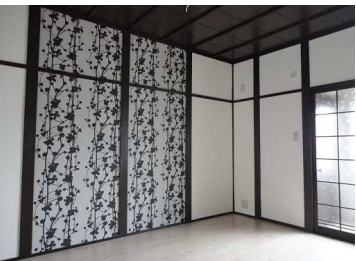
2階 プライベートルーム 8帖